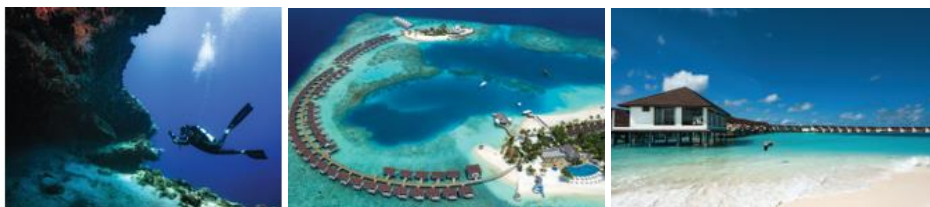
Didascalìa > Da sinistra a destra, Vista aerea dell'OBLU SELECT Logibili, Vista aerea dell'isola al tramonto