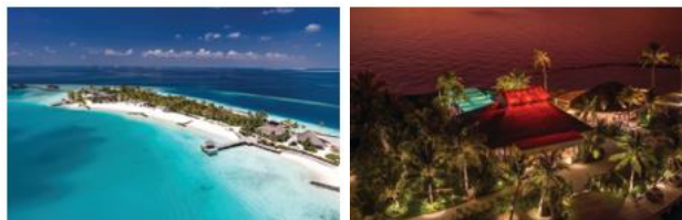
Didascalìa > Da sinistra a destra, Esterno al tramonto del residence, Vista aerea del RAAYA By Atmosphere