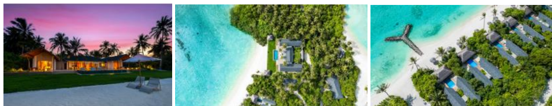
Didascalìa > Da sinistra a destra Vista aerea della family villa, Vista aerea dell'isola che ospita il VARU By Atmosphere